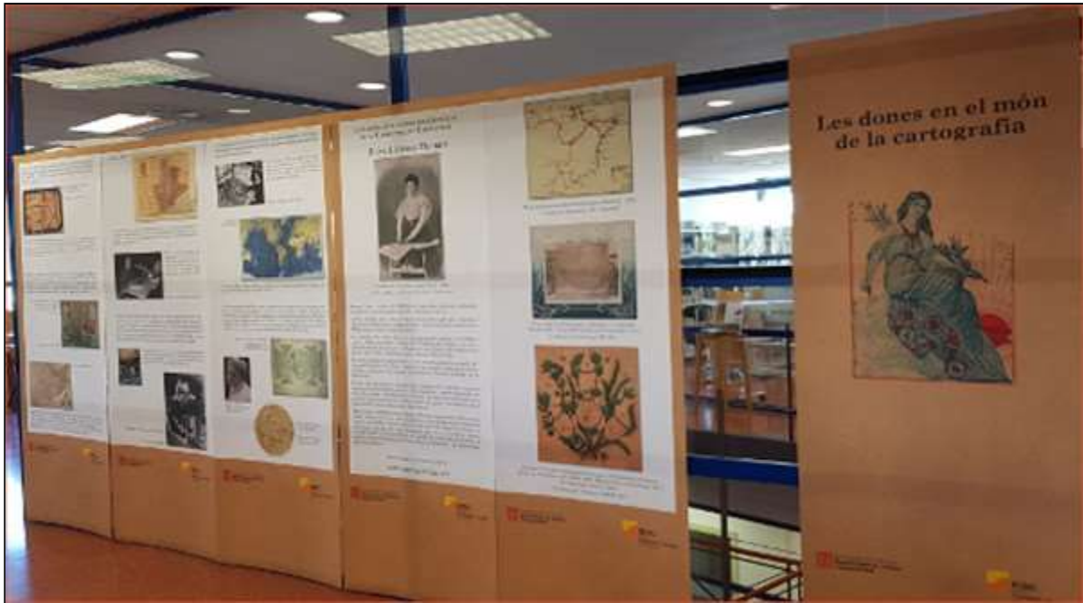
Figura 3. Exposició "Les dones en el món de la cartografia" el setembre de 2019 a l'EPSEB de la UPC.

El concepte i el contingut van ser desenvolupats íntegrament pel personal propi de la Cartoteca. Al llarg dels vuit plafons es repassava el paper de les dones com a autores de cartografia. També es dediquen dos plafons a l'única dona de la qual conservem l'arxiu personal i professional, la delineant barcelonina Leonor Ferrer, de la qual parlarem al punt següent. Com a material complementari es va maquetar un fulletó informatiu per a la promoció de l'activitat. El mateix 2018 també es va poder visitar a la seu de Barcelona del Departament de Territori i Sostenibilitat (Generalitat de Catalunya) i l'any següent a la Biblioteca de l'Escola Politècnica Superior d'Edificació de Barcelona (EPSEB) de la UPC.