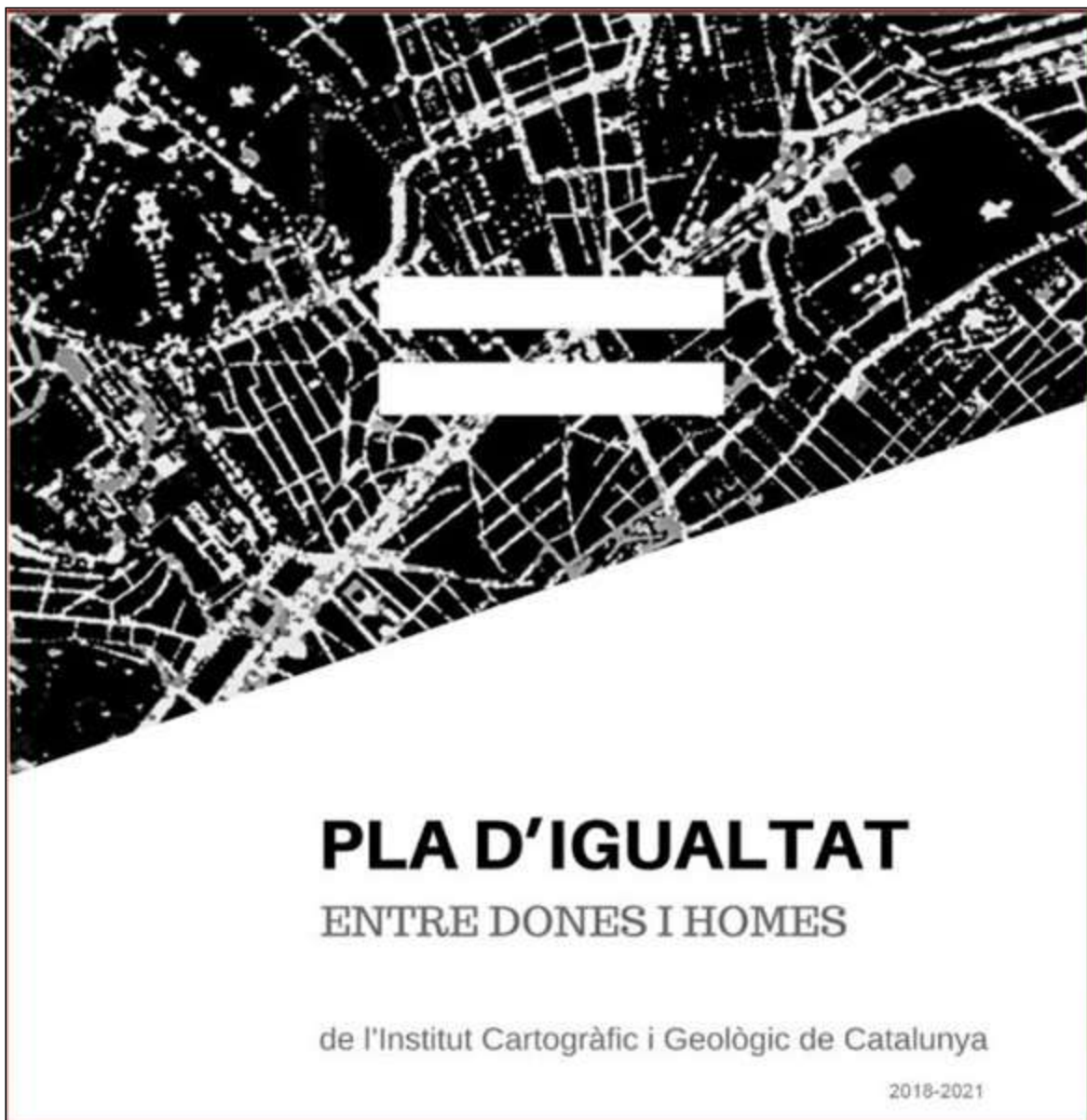
Figura 1. Coberta del Pla d'igualtat entre dones i homes de l'Institut Cartogràfic i Geològic de Catalunya (2018–2021)

El 2018, i com a iniciativa d'aquesta comissió d'igualtat de l'ICGC, es va encarregar a la Cartoteca organitzar una proposta per a la celebració del Dia Internacional de la Dona (8 de març). Aquest va ser el tret de sortida d'un seguit de projectes (iniciats, en procés i ja acabats) liderats per la Cartoteca en els quals es vol introduir una perspectiva de gènere a l'estudi i la difusió de la documentació que es conserva.