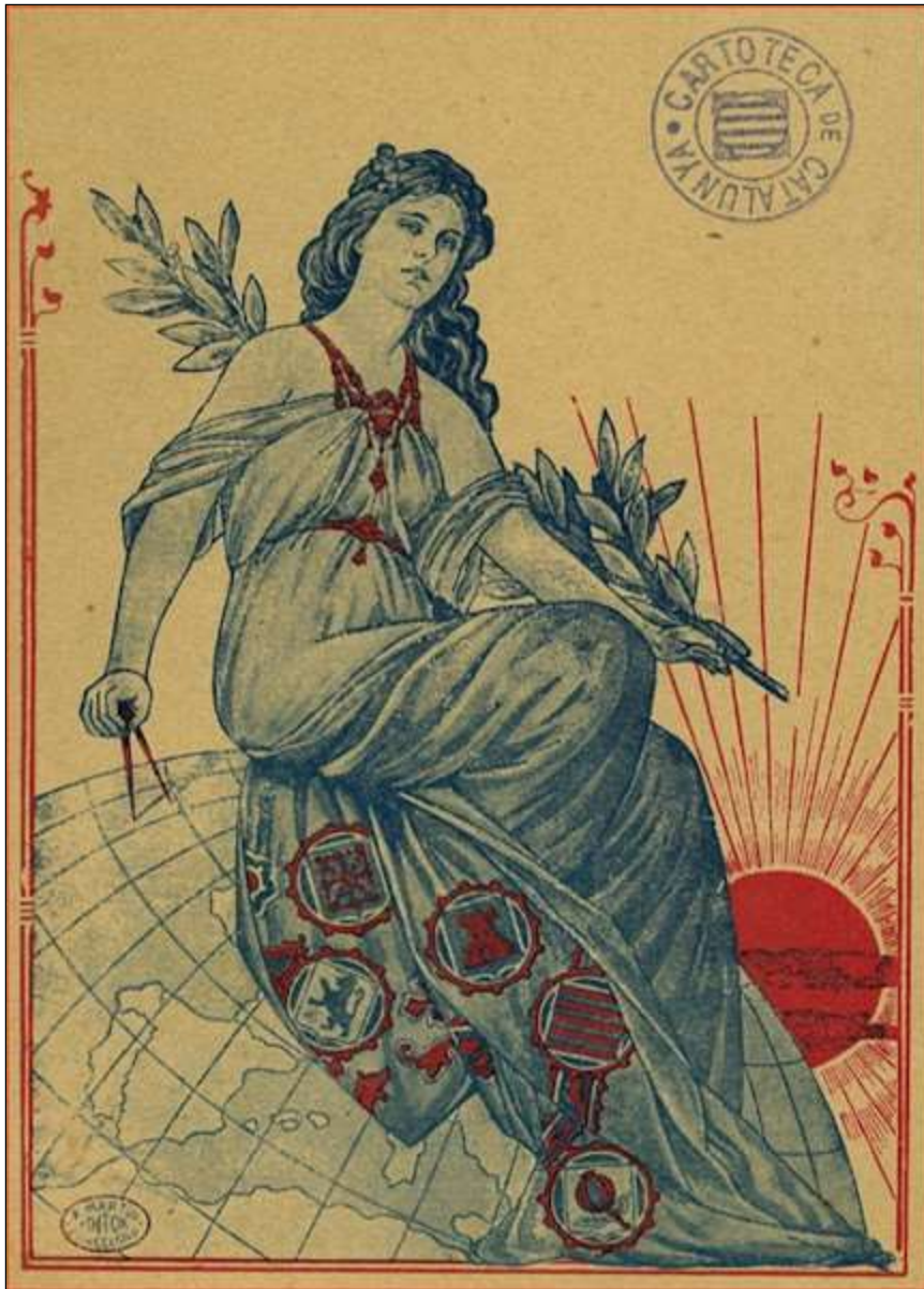
Figura 2. Logotip de l'editorial barcelonesa Alberto Martín utilitzat com a imatge per a l'exposició "Les dones en el món de la cartografia"