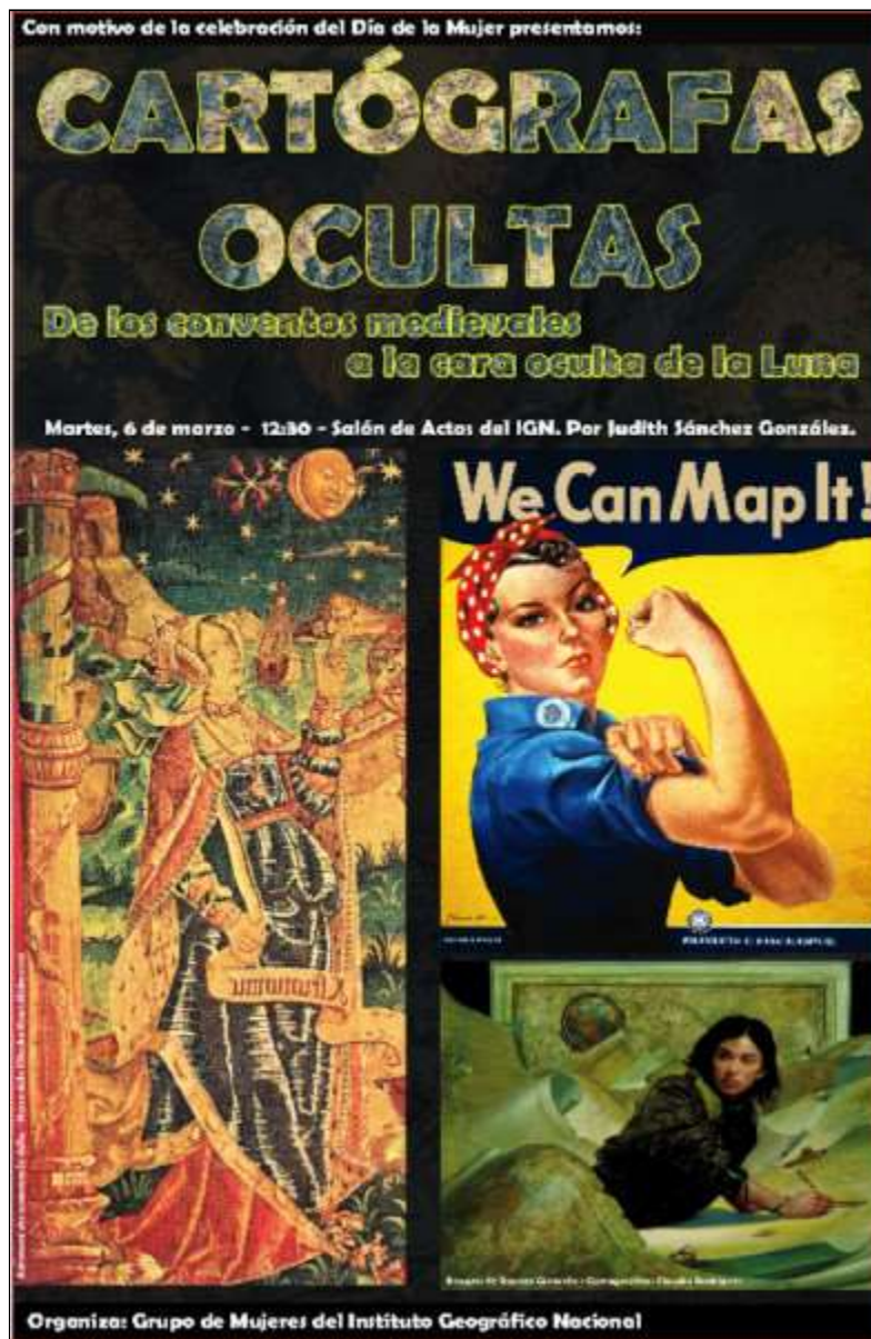
Figura. 4. Cartell de la conferència organitzada pel Grupo de Mujeres de l'IGN. Font: Instituto Geográfico Nacional