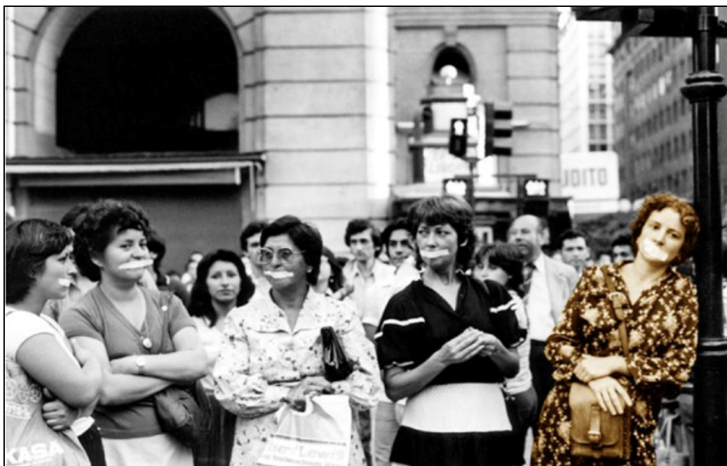
Imatge 1. Intervenció de carrer, centre de Santiago.

Els seus eslògans es refereixen a coordenades que vinculen, distingeixen, posicionen i legitimen les dones: la maternitat, "porque damos vida defendemos la vida"; la força, "somos una, somos +, somos fuerza de mujer", "adelante compañera, contamos con tu fuerza"; el compromís, "movilización de marzo va: palabra de mujer", i la constitució d'una majoria capaç d'alterar el curs de la història, "no + porque somos +", "no + La Libertad tiene nombre de mujer", "al hablar de democracia hay que pensar en las mujeres".