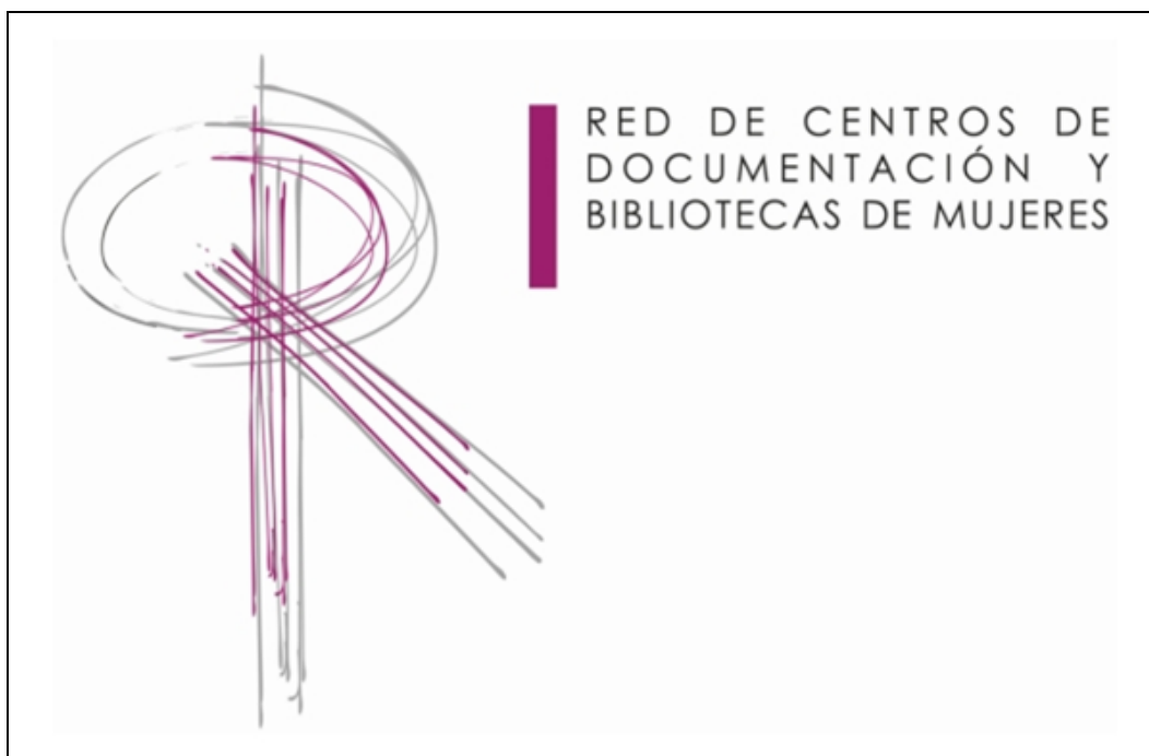
Figura 4. Logo de la Red de Centros de Documentación y Bibliotecas de Mujeres de l'Estat espanyol.

La Red de Centros de Documentación y Bibliotecas de Mujeres es crea l'any 1994 i integra totes les biblioteques i centres de documentació creats per associacions de dones, organismes públics d'igualtat i grups d'investigació de l'Estat espanyol. Una de les funcions principals és controlar cooperativament l'explosió bibliogràfica sobre temes de gènere i dones i oferir un millor servei a les usuàries de les diferents unitats d'informació que la conformen.