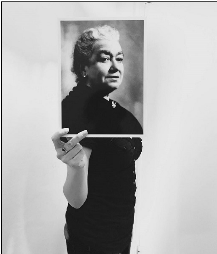
Figura 3. Foto de perfil del compte de Twitter @bibfbonnemaision.

Al compte de Facebook compartim articles d'interès, recomanacions i guies de novetats de la col·lecció i fem difusió d'activitats. Aquest compte també ens ha ajudat a fer-nos veure i atraure noves usuàries.