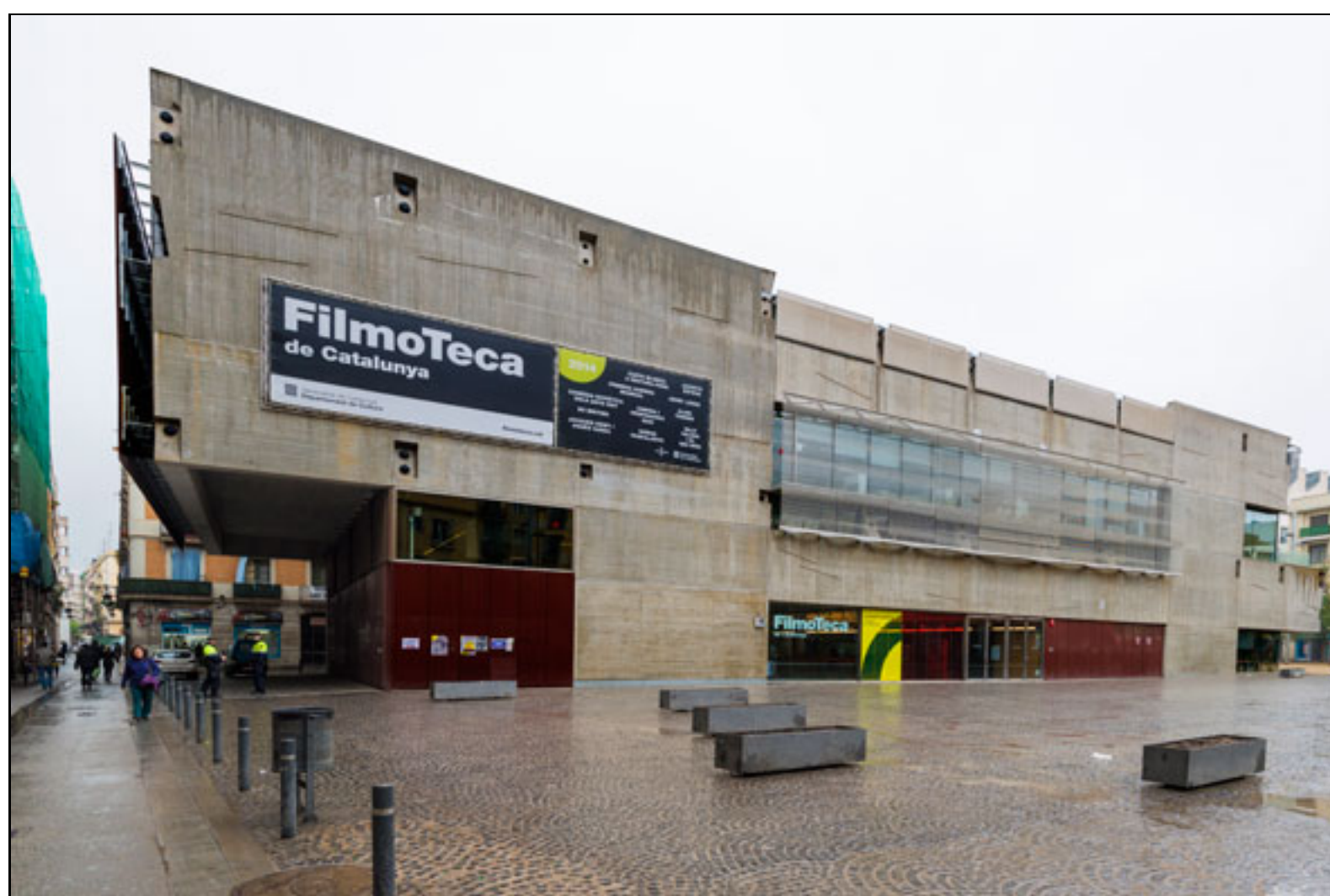
Figura 1. Sede de la Filmoteca de Catalunya en Barcelona

En 2012 el impulso a la Filmoteca de Catalunya se completaba con un traslado ambicioso de las antiguas dependencias a las dos nuevas sedes: el edificio del barrio del Raval, en Barcelona, donde conviven oficinas y depósitos de preservación documental con espacios abiertos al público (salas de proyección, sala de exposiciones, biblioteca especializada), y el edificio del Centro de Conservación y Restauración (2CR), en el Parque Audiovisual de Cataluña ( http://www.parcaudiovisual.cat/es ), en Terrassa, construido i diseñado para garantizar la conservación del patrimonio fílmico, sea analógico o digital.