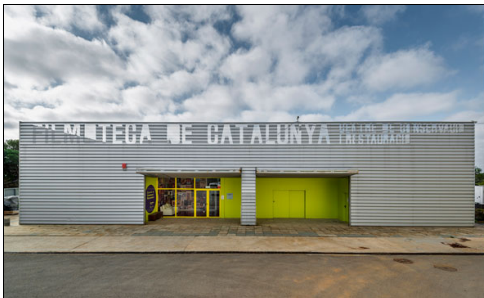
Figura 2. Sede del 2CR de la Filmoteca de Catalunya en el Parque

Audiovisual de Cataluña (Terrassa)