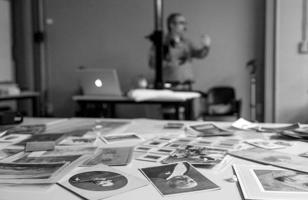
Figura 2. Sessió docent de digitalització d'originals fotogràfics a l'IEFC. Foto: Joan Ribó / IEFC. 2017

orientats a l'estudi i coneixement pràctic dels diferents suports de la fotografia química al llarg de la història— amb l'objectiu d'identificar i tenir cura dels principals processos de degradació, tot evitant-los quan sigui possible; així com donar pautes per a una correcta manipulació i difusió dels originals. S'ofereix també un seminari en digitalització d'originals fotogràfics, un tema poc tractat en altres espais formatius. Mes de dos-cents professionals han gaudit d'aquesta oferta, que evidencia la necessitat de conèixer de primera mà allò amb què treballen: fotografies fetes i materialitzades per multitud de processos amb les seves vulnerabilitats i diferències constitutives.