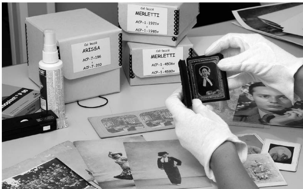
Figura 1. El patrimoni fotogràfic es caracteritza per la seva diversitat de suports i formats.

Una altra característica força freqüent és la recepció de fotografies dins de conjunts orgànics creats pels seus autors o productors. Dins d'aquest context, cada fotografia pren nous significats que provenen del conjunt i no del document individual. El tractament dels documents com a part de les col·leccions o fons a què pertanyen esdevé necessari per no perdre part del seu potencial, cal respectar curosament el principi de procedència. Així mateix, s'imposa una visió més àmplia del patrimoni fotogràfic que tingui en compte altres