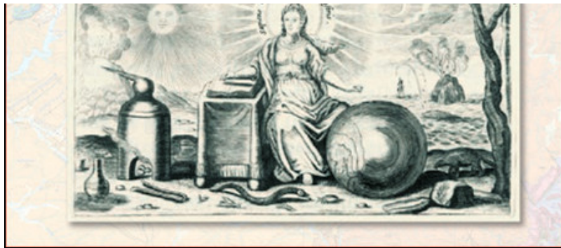
Figura 5. Cartel de la exposición "Geología en femenino".

La exposición recogía ocho aportaciones científicas relevantes en el mundo de la geología que habían sido hechas por mujeres y que, en algunos casos, habían sido invisibilizadas. De esta manera se resaltaba el papel de las geólogas en el avance de una disciplina con nombres mayoritariamente masculinos y donde las contribuciones hechas por las mujeres son muy desconocidas. Cada panel narraba la trayectoria de una mujer geóloga y se completó con dos paneles de datos sobre la igualdad tanto en la búsqueda de la geología como en la presencia de mujeres en las subdirecciones de Geología del ICGC.