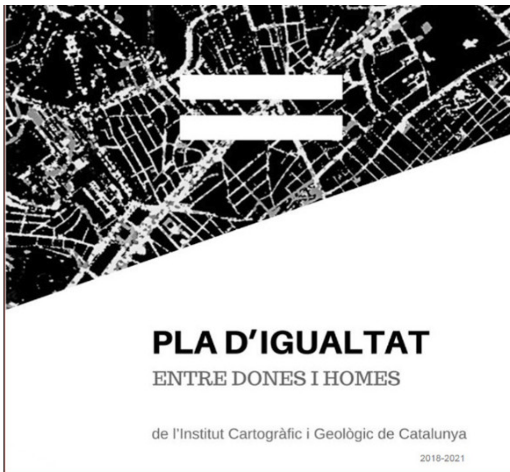
Figura 1. Cubierta del Plan de igualdad entre mujeres y hombres del Instituto Cartográfico y Geológico de Cataluña (2018-2021)