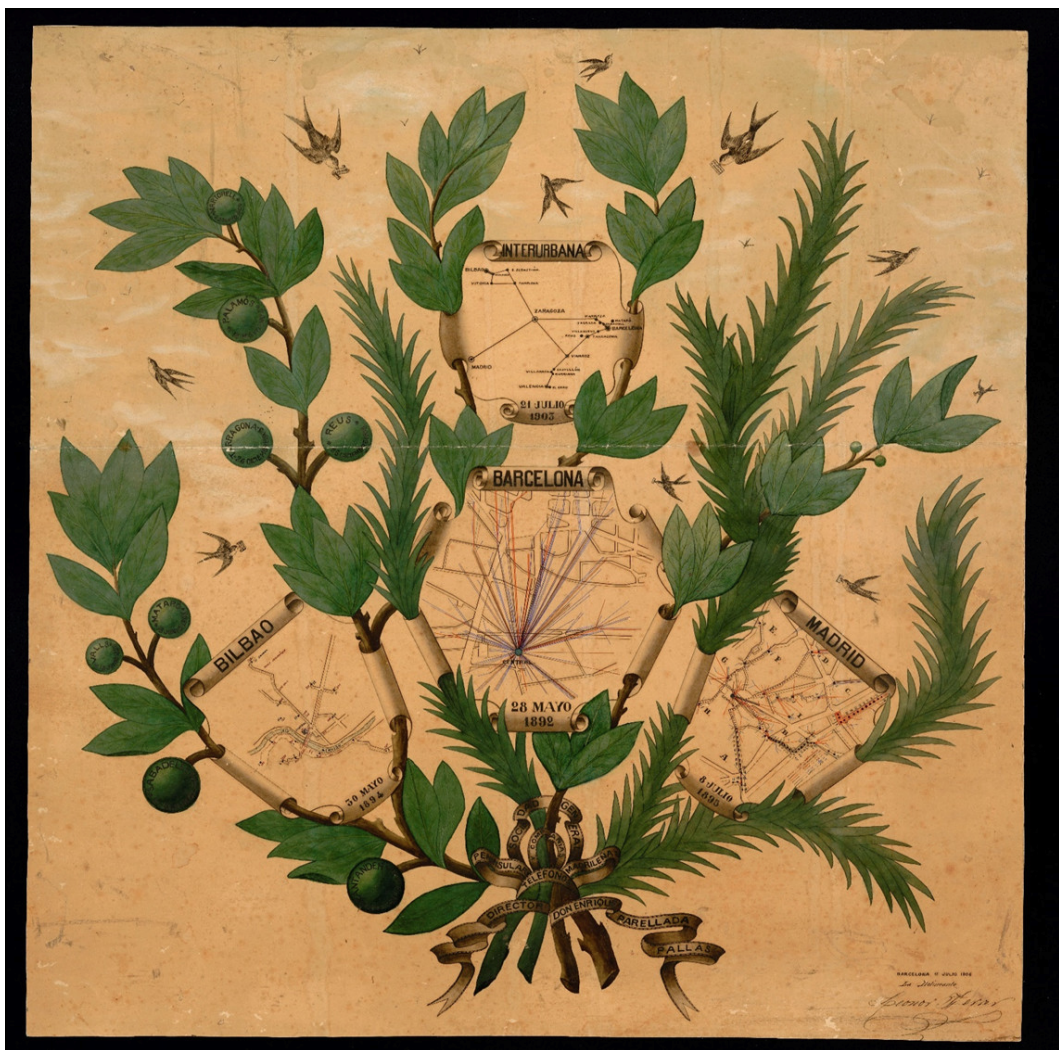
Figura 7. Mapa manuscrito dibujado per Leonor Ferrer. Sociedad General y Compañías Peninsular y Madrileña de Teléfonos, director Don Enrique Parellada Pallas. Cartoteca de Cataluña, Fondo Leonor Ferrer, RM. 281982.

La documentación profesional nos ha ayudado a reconstruir su vida laboral y muestra numerosos trabajos de delineación y dibujo manuscritos.