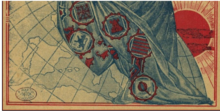
Figura 2. Logotipo de la editorial barcelonesa Alberto Martín utilizada como imagen para la exposición "Les dones en el món de la cartografia".

El concepto y el contenido fueron desarrollados íntegramente por el personal propio de la Cartoteca. A lo largo de los ocho paneles se repasaba el papel de las mujeres como autoras de cartografía. También se dedican dos paneles a la única mujer de la que conservamos el archivo personal y profesional, la delineante barcelonesa Leonor Ferrer, de la que hablaremos en el punto siguiente. Como material complementario se maquetó un folleto informativo para la promoción de la actividad. El mismo 2018 también se pudo visitar en la sede de Barcelona del Departamento de Territorio y Sostenibilidad (Generalidad de Cataluña) y el año siguiente a la Biblioteca de la Escuela Politécnica Superior de Edificación de Barcelona (EPSEB) de la UPC.