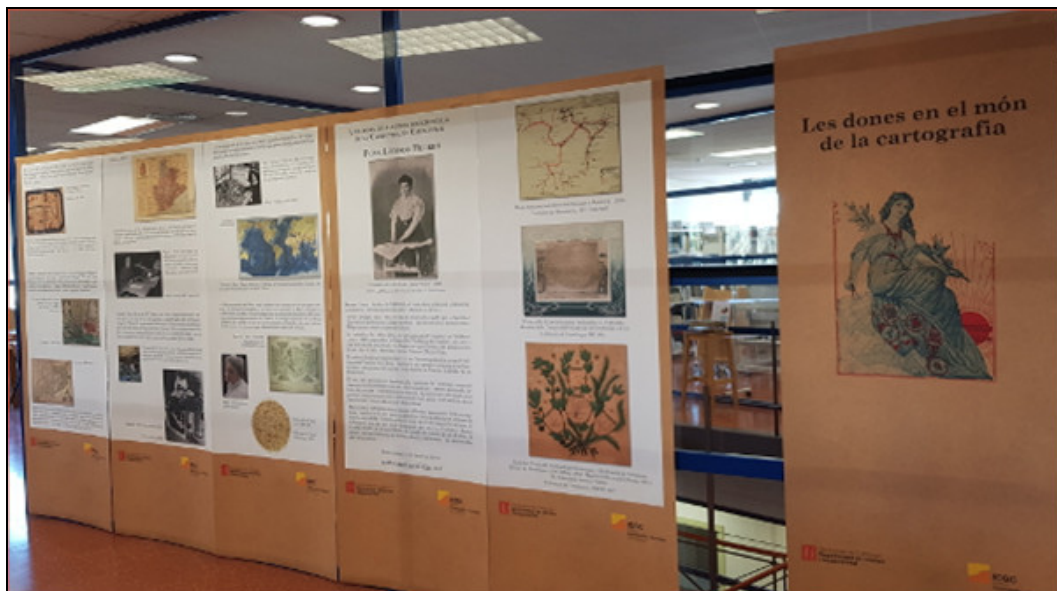
Figura 3. Exposición "Les dones en el món de la cartografia" en septiembre de 2019 en el EPSEB de la UPC.

El concepto y el contenido fueron desarrollados íntegramente por el personal propio de la Cartoteca. A lo largo de los ocho paneles se repasaba el papel de las mujeres como autoras de cartografía. También se dedican dos paneles a la única mujer de la que conservamos el archivo personal y profesional, la delineante barcelonesa Leonor Ferrer, de la que hablaremos en el punto siguiente. Como material complementario se maquetó un folleto informativo para la promoción de la actividad. El mismo 2018 también se pudo visitar en la sede de Barcelona del Departamento de Territorio y Sostenibilidad (Generalidad de Cataluña) y el año siguiente a la Biblioteca de la Escuela Politécnica Superior de Edificación de Barcelona (EPSEB) de la UPC.