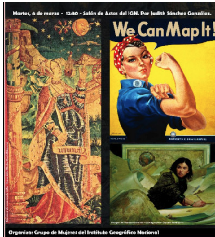
Figura 4. Cartel de la conferencia organizada por el Grupo de Mujeres de l'IGN.