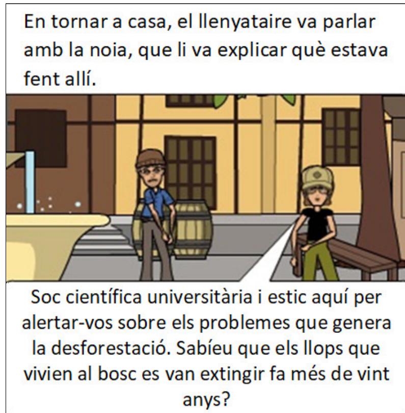
Figura 5. Fonts oficials Font. Luce, Soares, Estabel, 2020

La figura 4 representa una de les definicions de 'desinformació' encunyades pel Consell d'Europa (COE). La desinformació és definida pel COE (Wardle i Derakhshan, 2017) com a "information that is false and deliberately created to harm a person, social group, organization or country". La figura mostra el personatge de Seu Zé, que va lliurar diners a en Pere com a pagament pels serveis prestats i també li demana que mantingui en secret qualsevol acord que hagin pres tots dos.