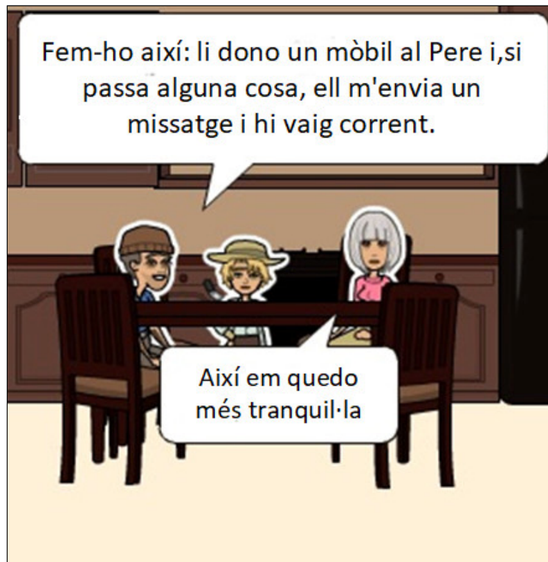
Figura 2. Dispositius electrònics (eines)

La figura 1 mostra la representació, per mitjà del discurs de la mare d'en Pere, de la construcció de la notícia falsa. La font d'informació no és clara "Vaig sentir al saló de bellesa de la Cleusa...". No és possible atribuir exclusivament a una persona la transmissió de la informació, i la història no té una base sòlida que provingui de fonts fiables.