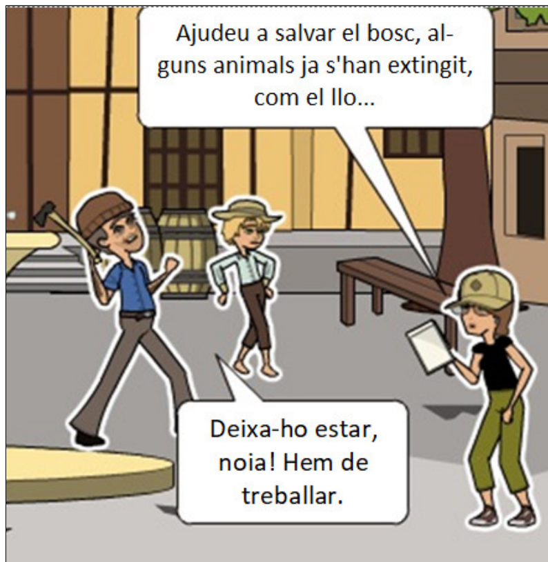
Figura 3. Postveritat Font. Luce, Soares, Estabel, 2020