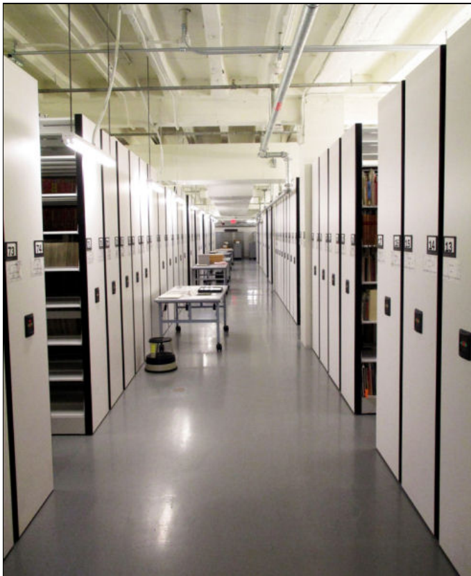
Figura 3. Espai per a emmagatzematge a l'interior de la biblioteca

Ateses les característiques especials d'aquesta col·lecció, que consisteix en diferents obres d'art i diaris i revistes, algunes de les quals amb més de cent anys d'antiguitat, tot el material es conserva en condicions controlades de temperatura i humitat (18 °C i 45 % d'humitat) i hi ha una persona dedicada exclusivament al manteniment de la col·lecció en paper, a més de dur a terme la digitalització de part del material conservat. L'espai estava inicialment pensat per permetre el creixement de la biblioteca durant cinquanta anys. No obstant això, la realitat ha superat totes les previsions. Només l'any 2016 van rebre cent quaranta-set donacions de material divers. A aquest ritme les instal·lacions disponibles es quedaran petites en un període de temps significativament més reduït. Un altre problema addicional per al qual s'està intentant buscar finançament és la contractació de personal per catalogar totes aquestes donacions.