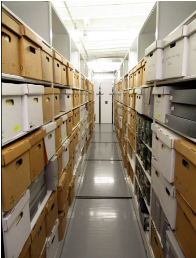
Figura 4. Part de la col·lecció de Milton Caniff

Secció 9. Àlbums de retalls: conté llibres de records, retalls de diaris i publicitat, premis, fotografies personals i il·lustracions originals.