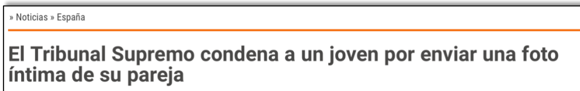
Ilustración 2: Radio Televisión Española - Noticias