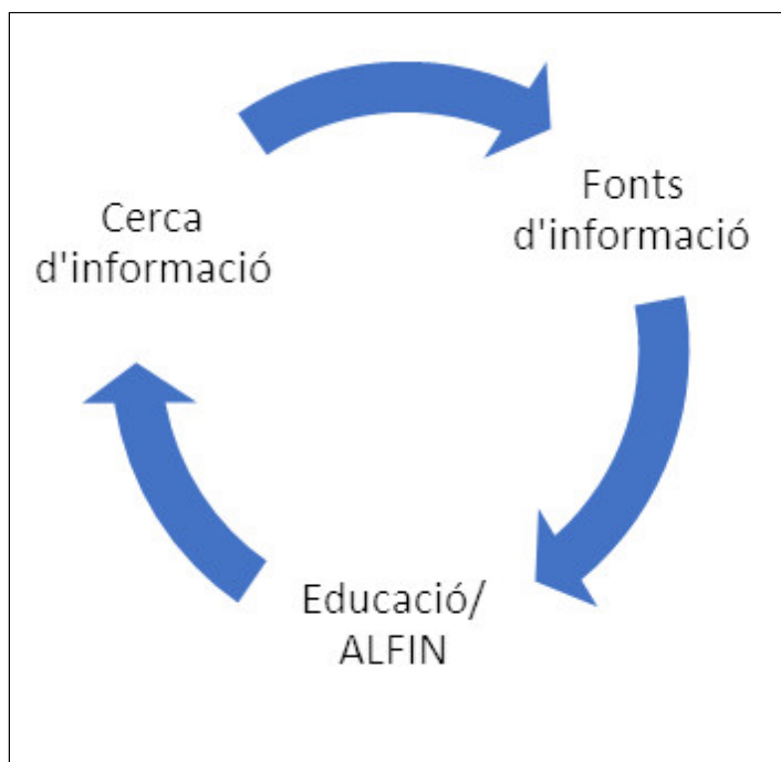
Figura 2. Representació del procés cíclic de cerca d'informació, fonts d'informació i educació