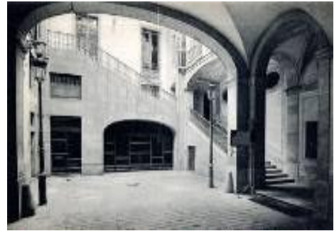
Entrada de Carruatges a principis del segle XX