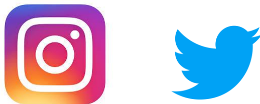
Logotips d'Instagram i Twitter

La meua proposta de millora, seria la de crear un Twitter i Instagram de la biblioteca de l'Ateneu en concret, crec que aquest departament juga un paper molt important dins de la institució i es podria diferenciar per si sol.