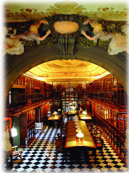
Biblioteca de l'Ateneu Barcelonès