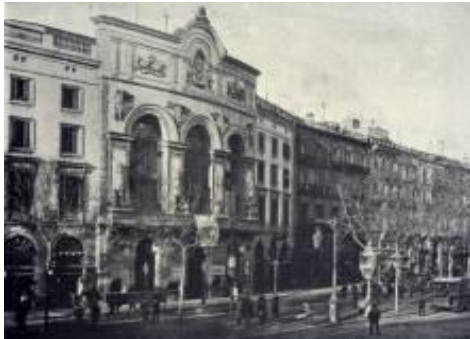
Primera seu de l'Ateneu, rambla dels Caputxins, 36-38

En conclusió, crec que l'edifici de l'Ateneu i especialment les sales de la biblioteca tenen molt valor arquitectònic i s'està lluitant perquè el seu atractiu sigui compatible amb la funcionalitat i confortabilitat dels espais, per això s'han realitzat reformes com la del 2005-2008, per a recuperar elements patrimonials, però també garantir la seguretat i adequació tecnològica de l'època que ens trobem, preparant-la pel futur.