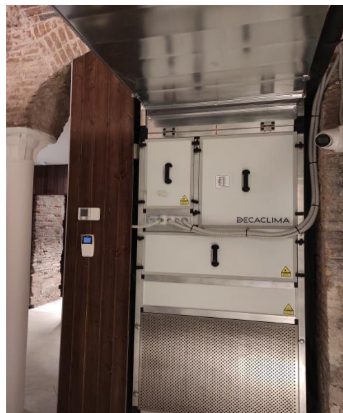
Equipament de climatització de l'Espai Rogent