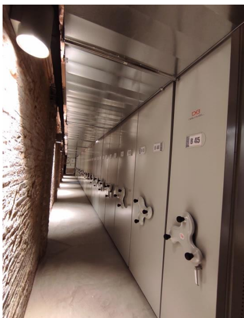
Nou Espai Rogent