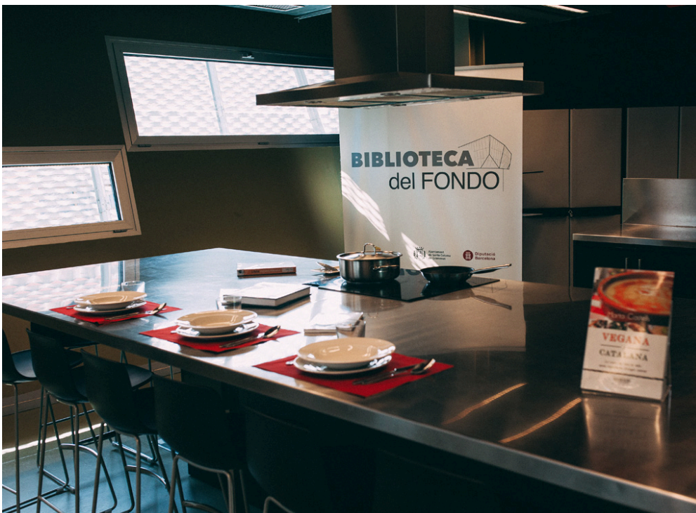
La cuina de la Biblioteca del Fondo a Santa Coloma de Gramenet