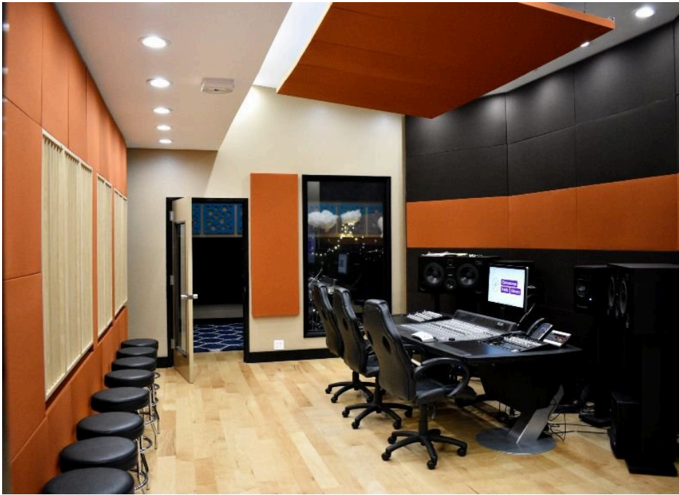
The Studio a la biblioteca pública de Chattanooga (Tennessee)